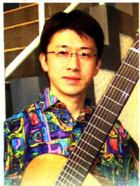
Viola 7 Cordas

7弦ギター、カヴァキーニョ、ヴィオラ・カイピラ、などを演奏する弦楽器奏者。1991年には初渡伯、1999年に再渡伯した時には、リオ・デ・ジャネイロに3ヶ月間滞在、現地で演奏活動をしながらショーロの7弦ギター演奏法などを学び、コンサートやラジオ・ナショナルのショーロの番組に出演。ブラジル新聞などメディアにも取り上げられる。